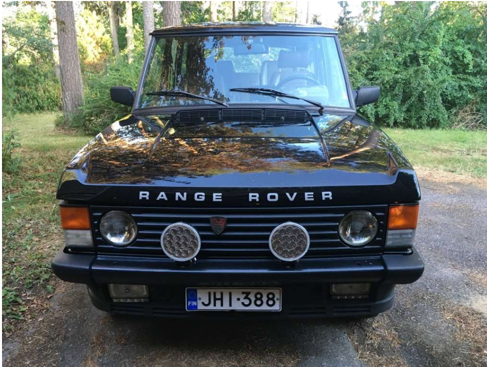
Autossa on valmiina Rover Ystävät maskimerkki !